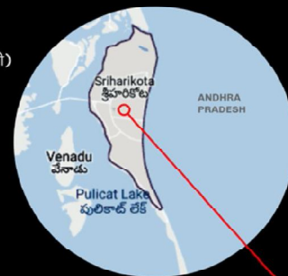
प्रक्षेपण स्थल श्रीहरिकोटा, आंध्रप्रदेश

अभियान की घोषणा - 18 सितंबर, 2008 लागत: 978 करोड़ रु. वजन: 3850 किलोग्राम