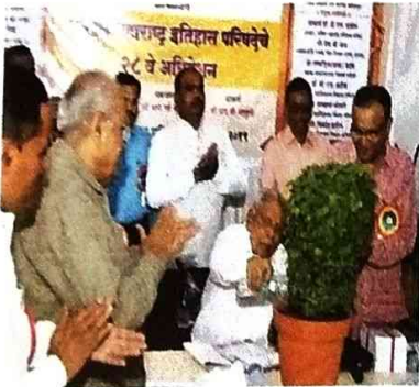
(इतिहास परिषदेचे उद्घाटन करतेवेळी प्रा. डॉ. एन.डी. पाटील)