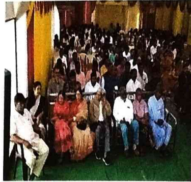
(उद्घाटन प्रसंगी उपस्थित मान्यवर व सहभागी व्यक्ती)