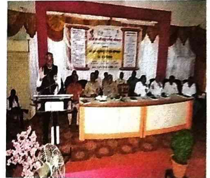
(समारोप समारंभ प्रसंगी मनोगत व्यक्त करताना मा. शेख सर)