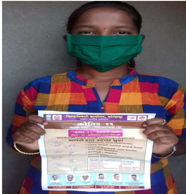
Covid-19 Virus Awareness by NSS Volunteer