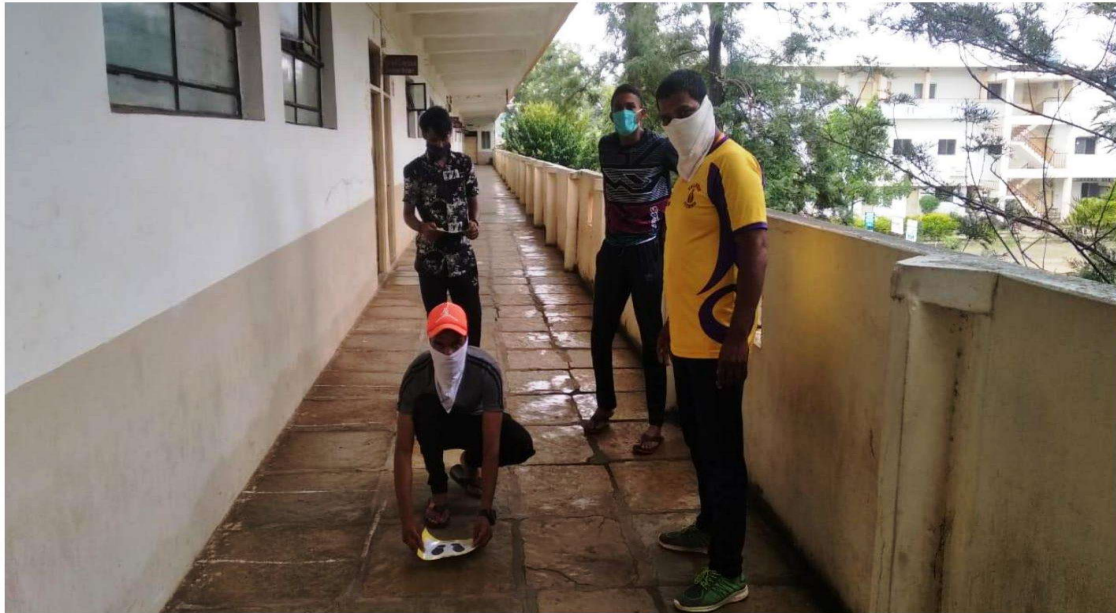
Social Distancing Marking