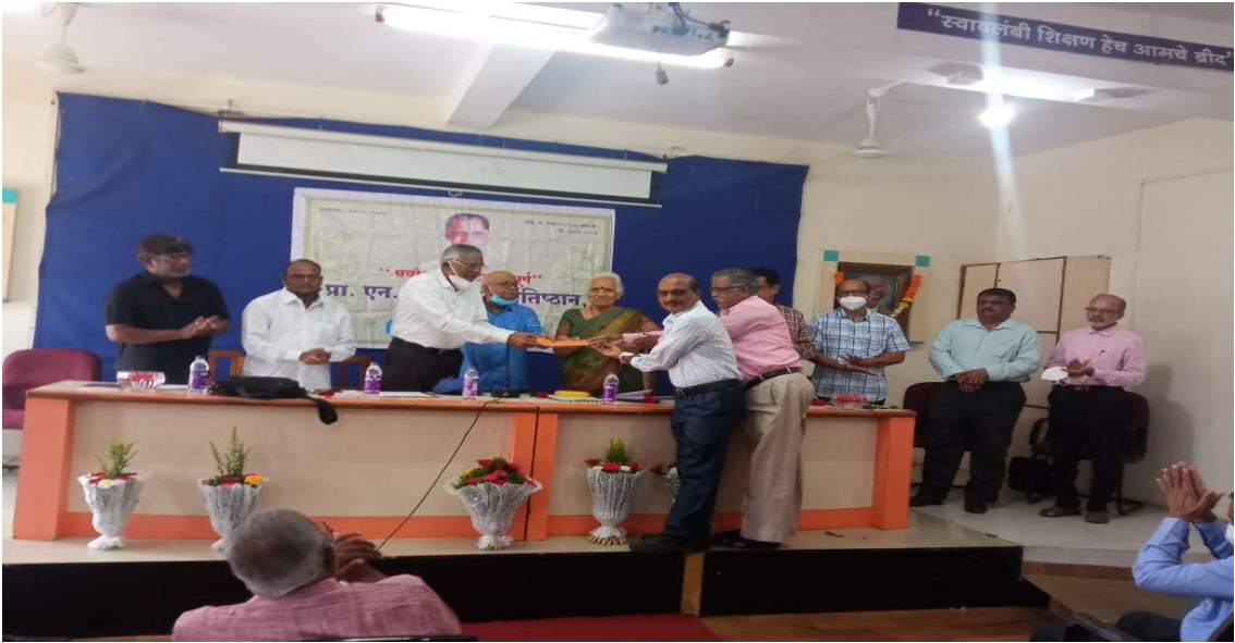
Financial assistant of Rs.42,500 to Dr.N D Patil Pratishthan for helping Covid Patients