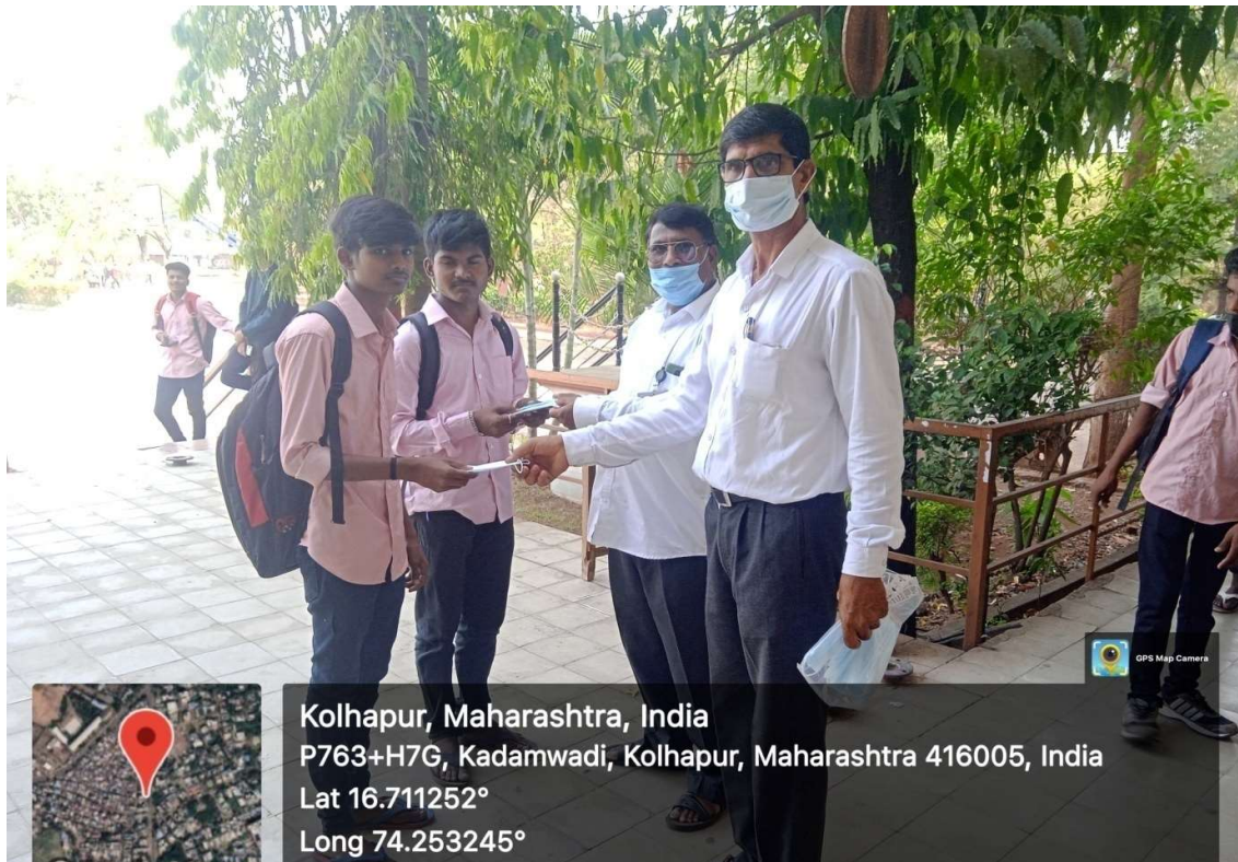
Distribution of Mask to students