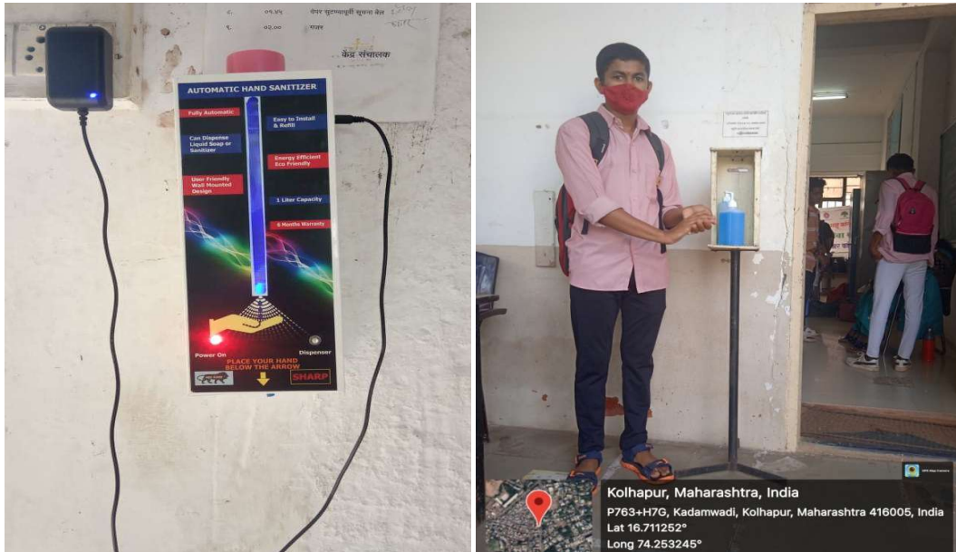
Hand Sanitizer Facility at College Campus