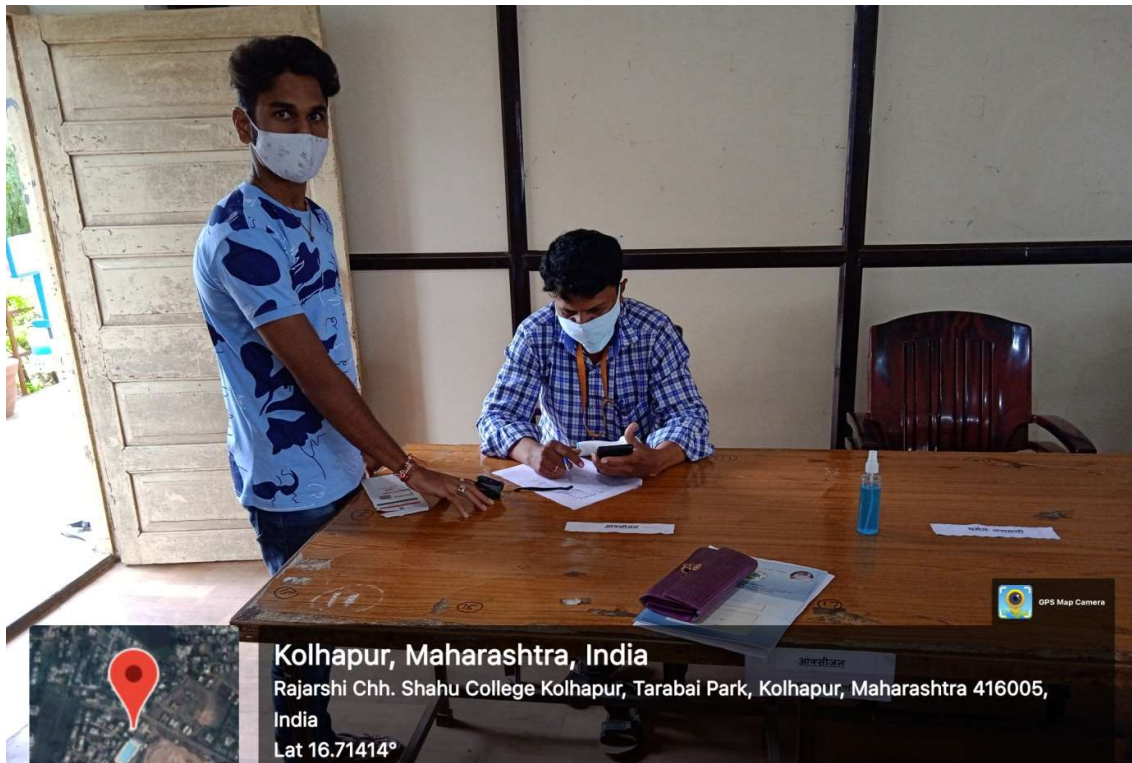
Checking of Oxygen level