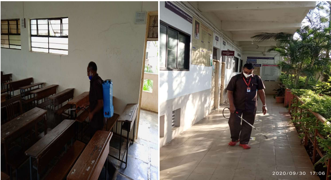
Sanitization of College campus