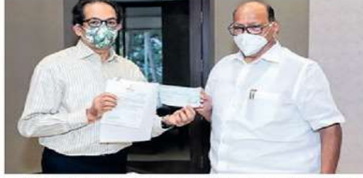
रयत शिक्षण संस्थेतर्फे अध्यक्ष शरद पवार यांनी मदतीचा धनादेश मुख्यमंत्री उद्धव ठाकरे यांच्याकडे सुपूर्द केला.

रयत शिक्षण संस्थेचा प्रत्येक शिक्षक आणि सेवकाला कोरोना महामारीच्या काळात आश्वस्त करण्याच्या दृष्टीने संस्थेने काही महत्त्वपूर्ण निर्णयही घेतले होते. रयतच्या ११ हजार रयत सेवकांनी त्यांचा एक दिवसाचा पगार मुख्यमंत्री निधीला देण्याचे ठरविले. यातून २ कोटी ७६ लाख रुपयांचा निधी जमा झाला. तर दीड कोटी अर्धा दिवसाचा पगार विद्यार्थी आणि सेवकांची